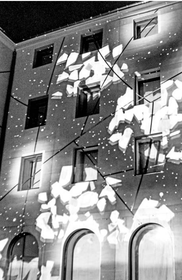
Fête des lumières 2017 Projets étudiants - Pôle Art&Design