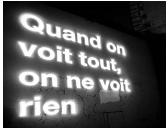
Daria Ayvazova La Cuisine 2014 Vernissage LJDD - Mai 2019